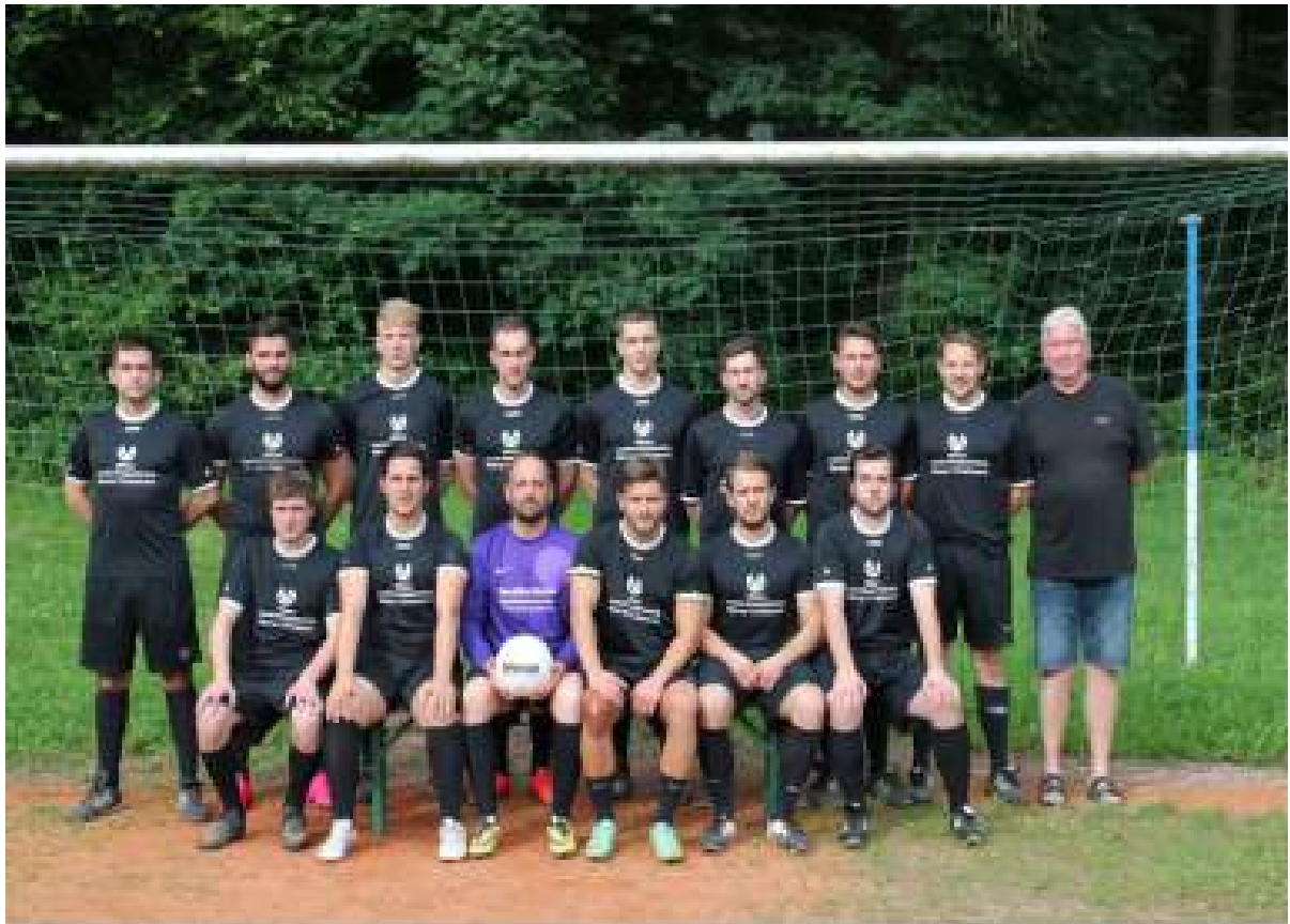
2. Mannschaft der Saison 2016/17