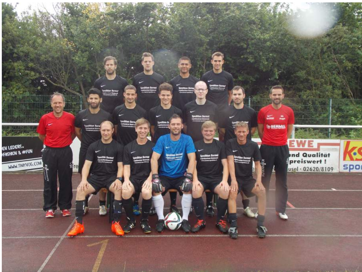
1. Mannschaft der Saison 2016/17